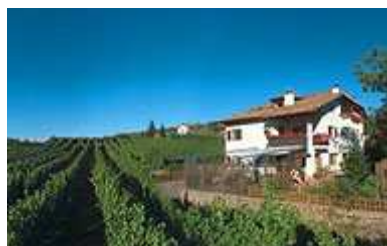
Sudtirolo H.Lun di Egna.

La produzione di vino gioca da noi da svariate generazioni un ruolo molto importante.